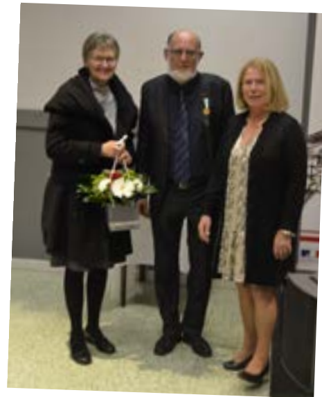
Remise de médaille au Maire