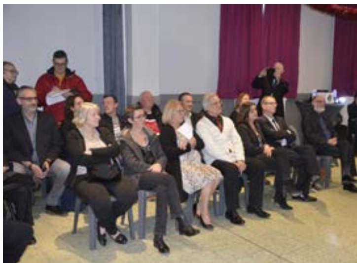
Les élus lors de la cérémonie des vœux