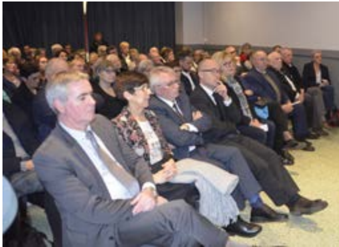
Les élus venus en nombre assister à la cérémonie