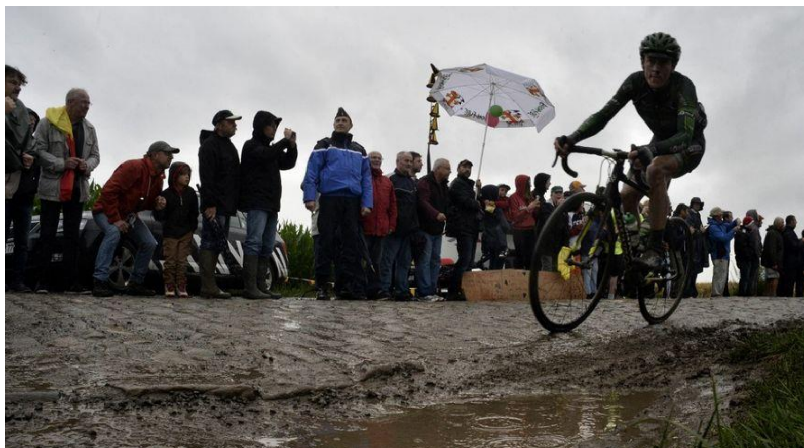
Le 6 Juillet, le Tour de France empruntera les pavés du Bois Delpierre lors de la 5ème étape entre Lille Métropole et Arenberg