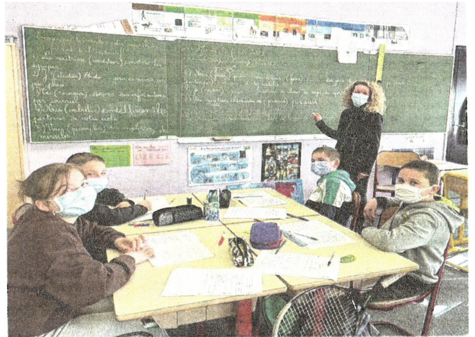
Pendant les cinq jours, les institutrices ne feront que des révisions avec les élèves le matin, avant de les emmener faire du sport, l'après-midi.