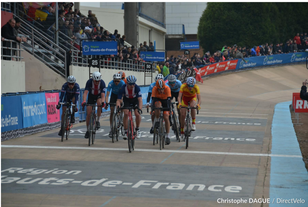
Paris-Roubaix Junior a traversé la commune le 17 Avril 2022