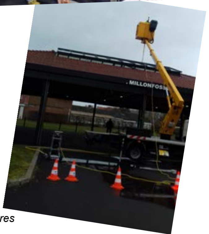
Nettoyage des verrières