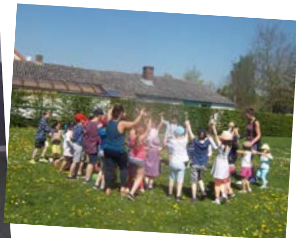
Lors de la pause méridienne, après le repas de cantine les enfants s'amuse bien